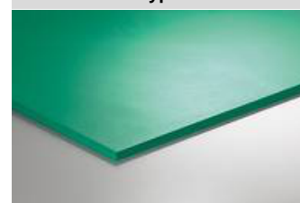
Illustration du type