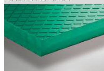
Illustration de l'article