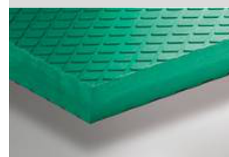
Illustration de l'article